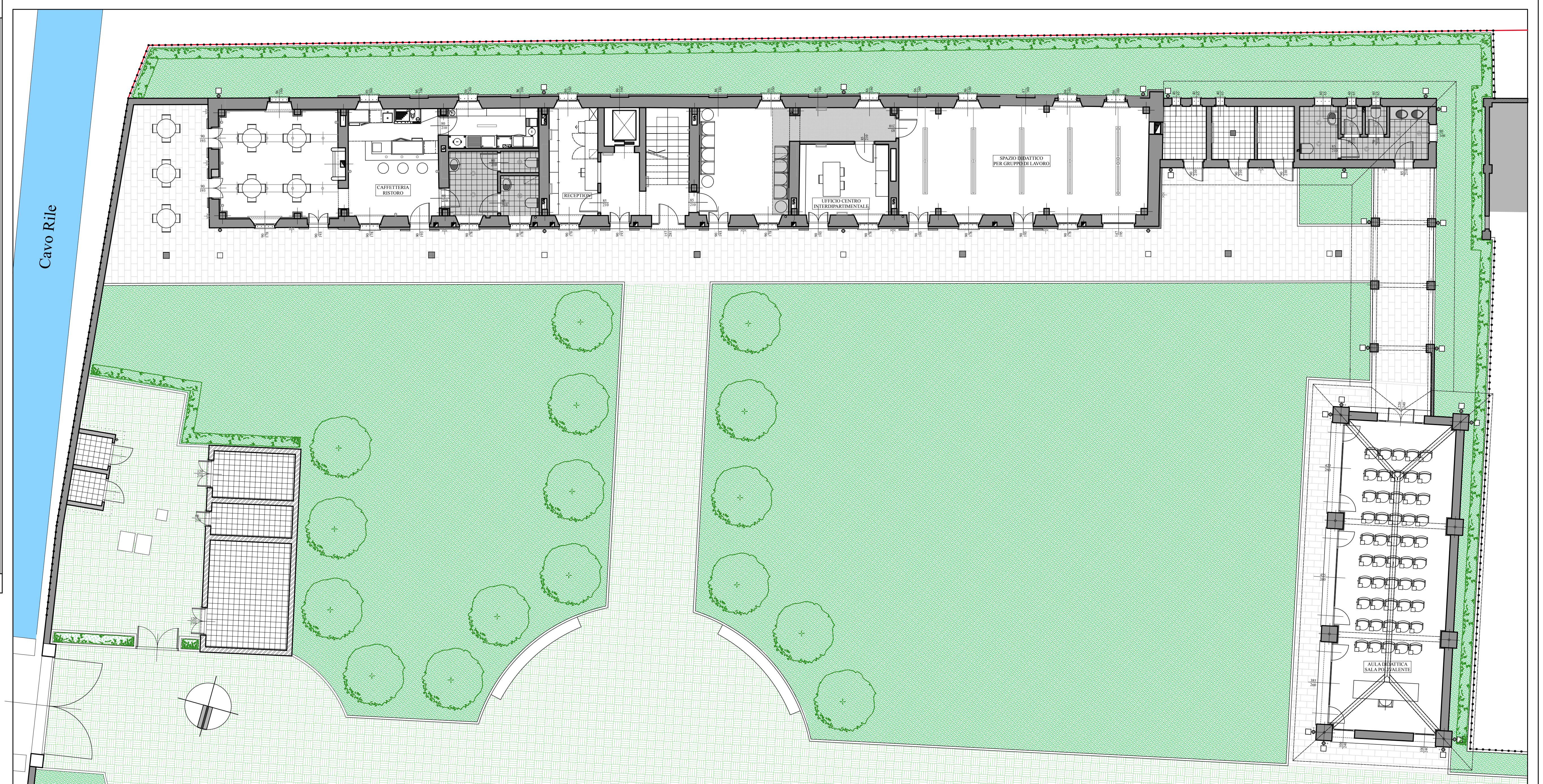
PIANTA PIANO TERRENO

ARCHITETTO tel. 0163/24904 PEC: massimo.corradino@archiworldpec.it